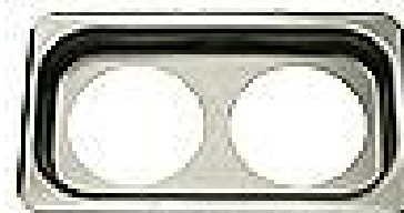
Lochdeckel aus Edelstahl für 90 mm Einsätze