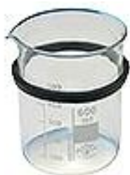
Glaseinsatz mit Haltering 600ml